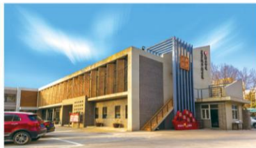
▲ 夕阳下的设计院